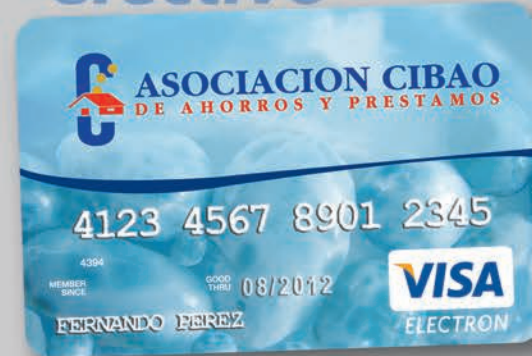
Tarjeta de Débito