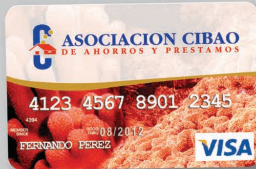
Tarjeta de Crédito