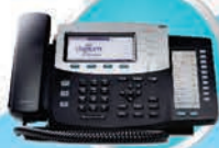
DIGUM D70 PHONE