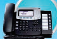
DIGUM D50 PHONE