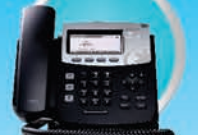
DIGUM D40 PHONE