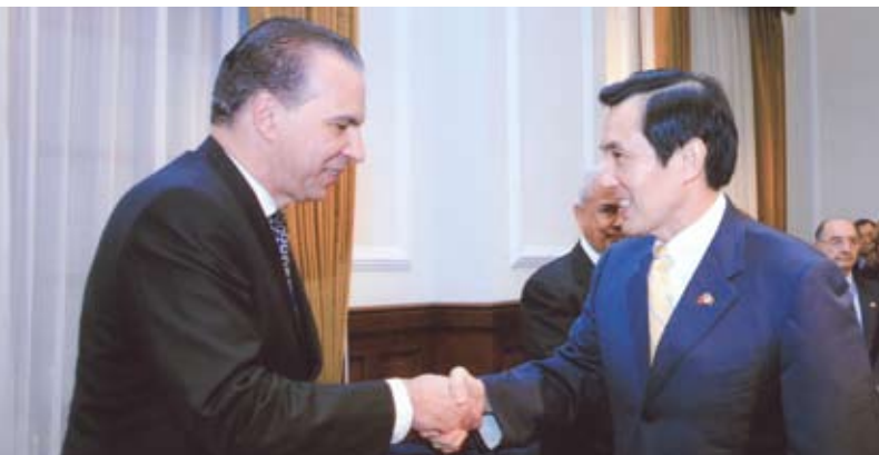
Oliverio Espaillat, Presidente de la Cámara saluda al Presidente de la República de Taiwán Ma Ying-jeou.