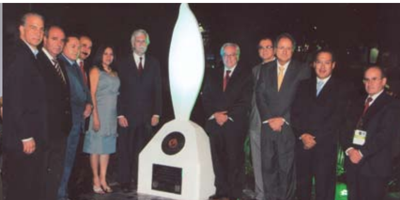
Directiva de AICO, septiembre 2010. Cali, Colombia.